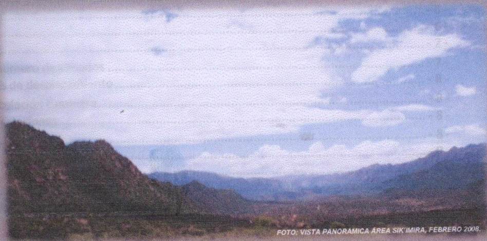
FOTO: VISTA PANORAMICA AREA SIK'IMIRA, FEBRERO 2008.